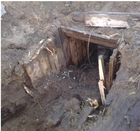
Подкоп к трубопроводу