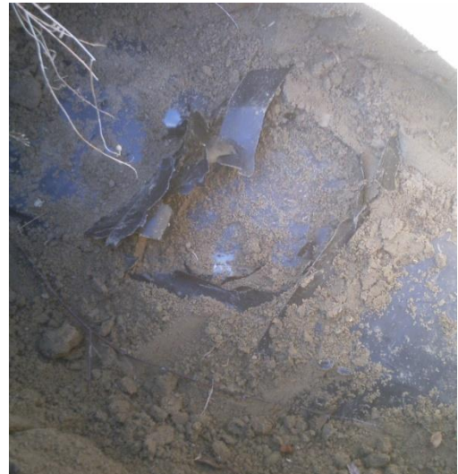
Нарушение изоляционного слоя нефтепровода