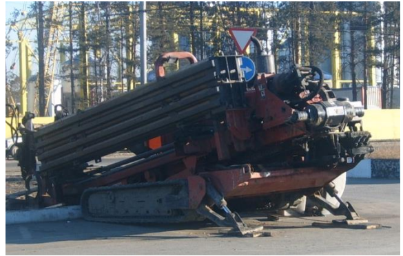
Машина для горизонтально-направленного бурения