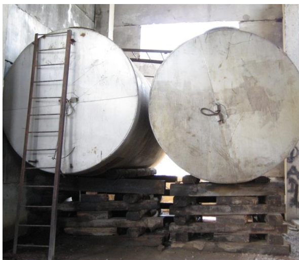
Емкости для перекачки похищенной нефти