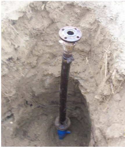
Несанкционированная врезка в толще грунта