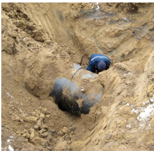
Врезка в трубопроводе в толще грунта