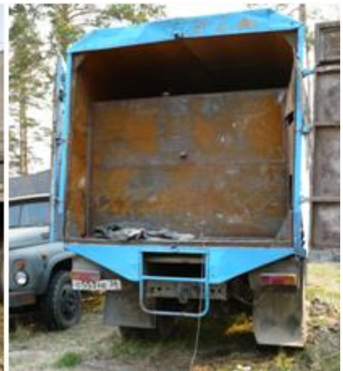
Автомобиль ЗИЛ с установленной и замаскированной емкостью для транспортировки похищенного нефтепродукта