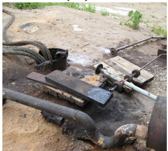
Вкопанная емкость для слива похищенной нефти