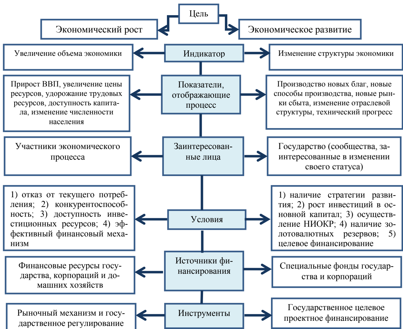
Рисунок 1 – Экономическое развитие и экономический рост: через призму финансирования*

Если в качестве целевого ориентира выбирается экономическое развитие, это означает, что лицом, заинтересованным в достижении данной цели будет являться государство, и достижение данной цели потребует разработки специального финансового инструмента – государственного целевого проектного финансирования (рис. 1).