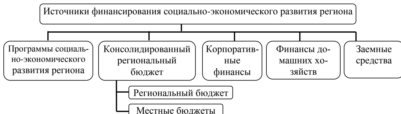
Рисунок 3 – Современные источники финансирования социально-экономического развития субъектов Российской Федерации*

Все это не позволяет региональным органам власти генерировать экономический рост и экономическое развитие.