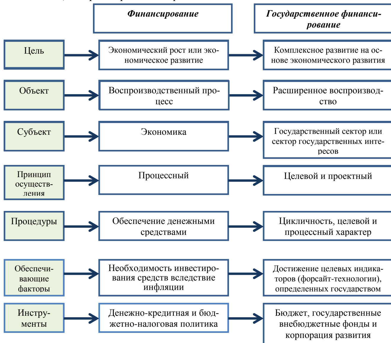
Рисунок 2 – Финансирование и государственное финансирование: основные различия категорий*

Рассматривая перечисленные принципы, можно сделать вывод, что понятия финансирование и государственное финансирование имеют принципиальные отличия, которые отражены на рис. 2.