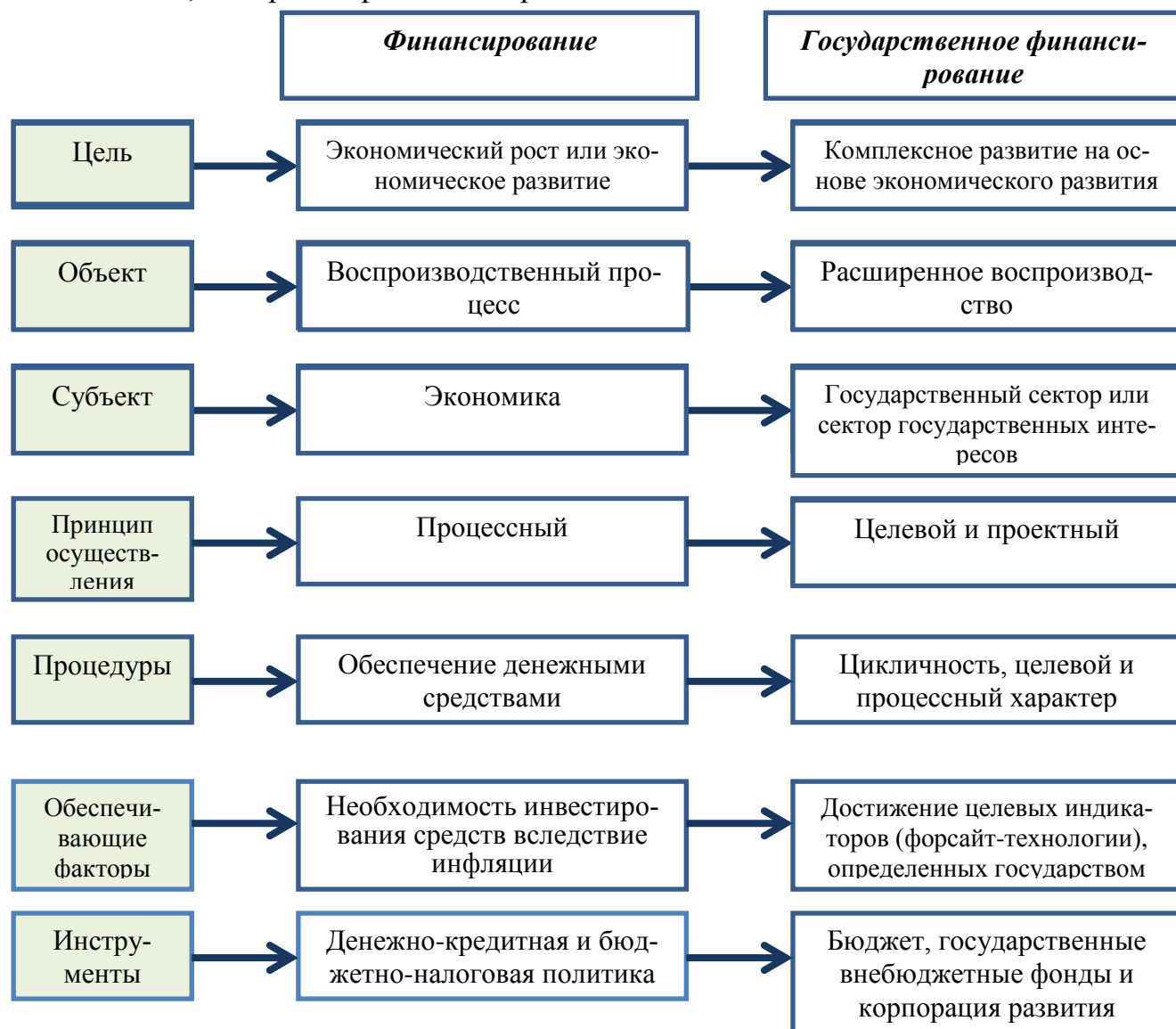
Рисунок 2 – Финансирование и государственное финансирование: основные различия категорий*

Рассматривая перечисленные принципы, можно сделать вывод, что понятия финансирование и государственное финансирование имеют принципиальные отличия, которые отражены на рис. 2.